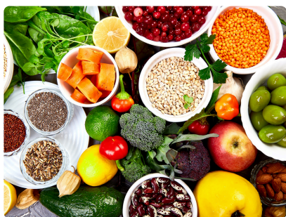
SEMAINE DU GOÛT