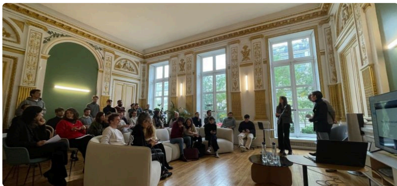
JOURNÉE INTERNATIONALE DES DROITS DES FEMMES

La Journée internationale des droits des femmes du 8 mars est l'occasion de promouvoir l'égalité des sexes au sein de son entreprise, en sensibilisant l'ensemble des collaborateurs aux enjeux de la parité et de l'inclusion