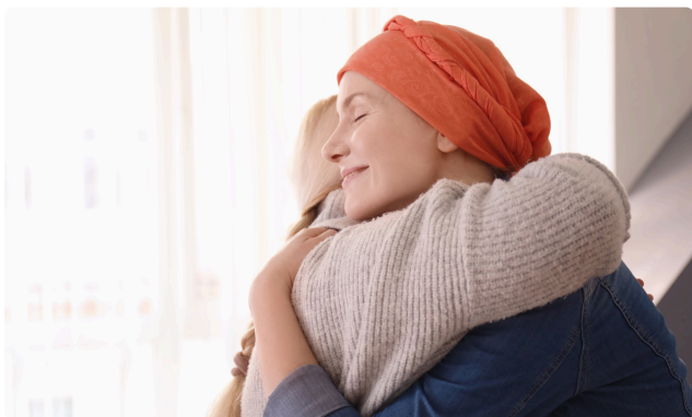
JOURNÉE MONDIALE DE LUTTE CONTRE LE CANCER