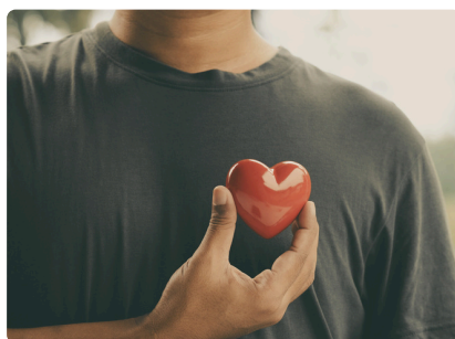
JOURNÉE MONDIALE DE LA SANTÉ