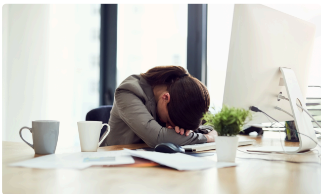
PRÉVENTION DES RPS / BURN-OUT