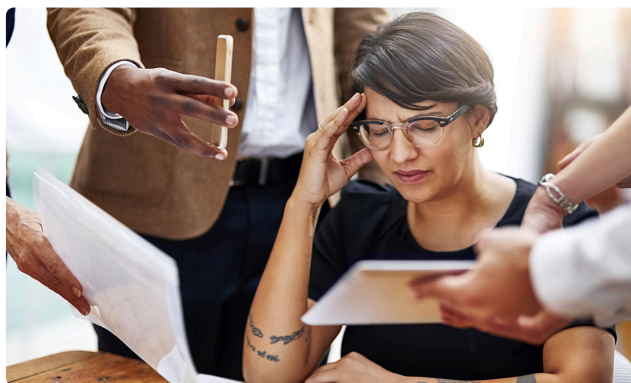
GESTION DU STRESS ET DES ÉMOTIONS