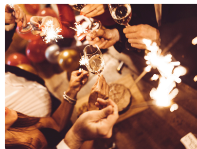
SOIRÉE DE FIN D'ANNÉE