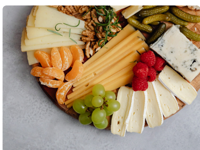
AFTER WORK DE RENTRÉE