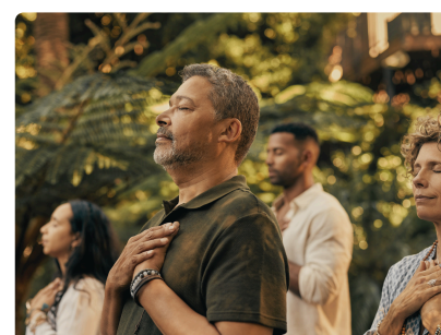
SEMAINE DE LA QVT