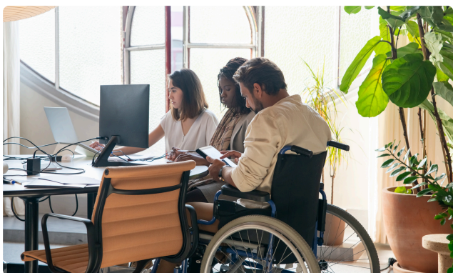
SEMAINE POUR L'EMPLOI DES PERSONNES HANDICAPÉES