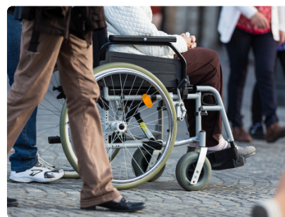
SEMAINE DU HANDICAP