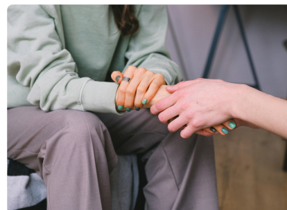
JOURNÉE DE LA SANTÉ MENTALE