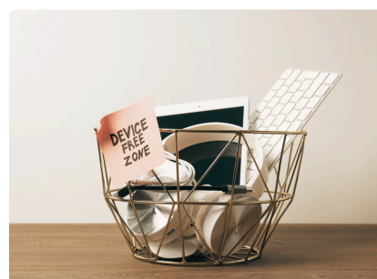
JOURNÉES MONDIALES SANS TÉLÉPHONE PORTABLE