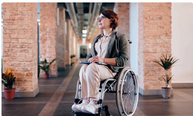
JOURNÉE DE LA SCLÉROSE EN PLAQUES