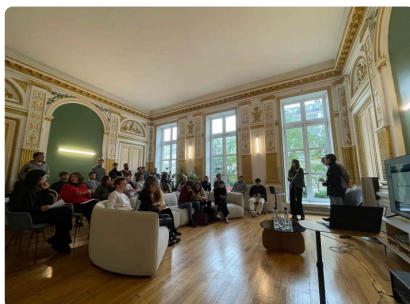
VULNÉRABILITÉS ET RÉSILIENCE