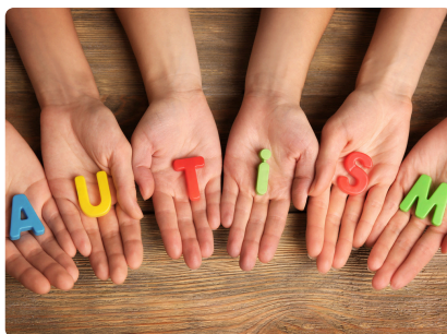
SENSIBILISATION À L'AUTISME