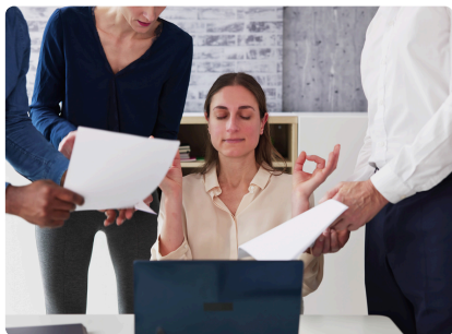
GESTION DES CONFLITS