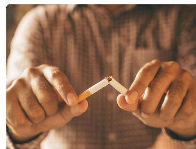
JOURNÉE MONDIALE SANS TABAC