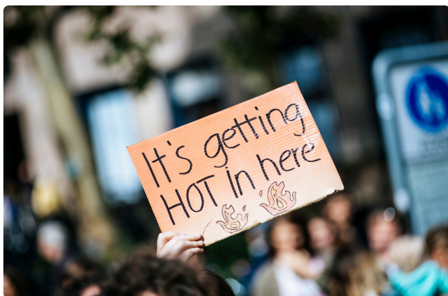
ATELIER FRESQUE DU CLIMAT

Atelier d'intelligence collective basé sur le rapport du GIEC pour comprendre les enjeux climatiques