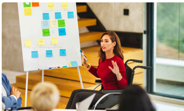
JOURNÉE MONDIALE DES PERSONNES HANDICAPÉES