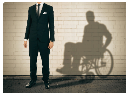
JOURNÉE DE LA FIBROMYALGIE