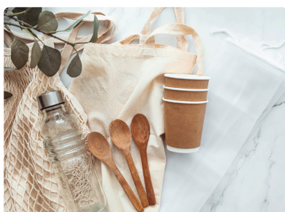
PLATEAU REPAS ZÉRO DÉCHET